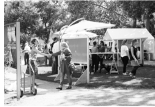
studio biebrich, Juni 2019

Çalıştay başına maksimum katılımcı sayısı: 12 kişi