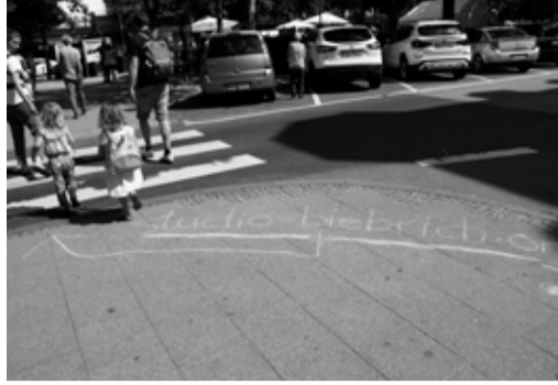
studio biebrich, Juni 2019

ستوديو بيبيريش (Biebrich) تدعوكم يوم الخميس الموافق 31 أكتوبر للحوار مع بعض ومع الجار والجاره ومع مواطنين بيبيريش السؤال متي وكيف تشعر بالمواطنة في بلدك الثاني بيبيريش نريد التحاور معا لكي تندمج انت واسرتك مع وفي المجتمع في Biebrich سوف نستمع لآراءك ونحاول تفعيلها وحل مشاكلكم