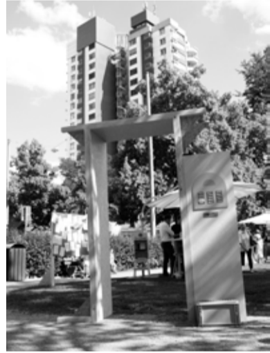
studio biebrich, Juni 2019

Max. Anzahl Teilnehmer*innen pro Workshop: 12 Personen